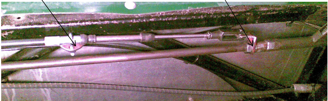
Feste til girstanga

Kabela ligger langs ramma bak til motorrommet, her går den under motoren og opp parallelt med girvelger på kassa: