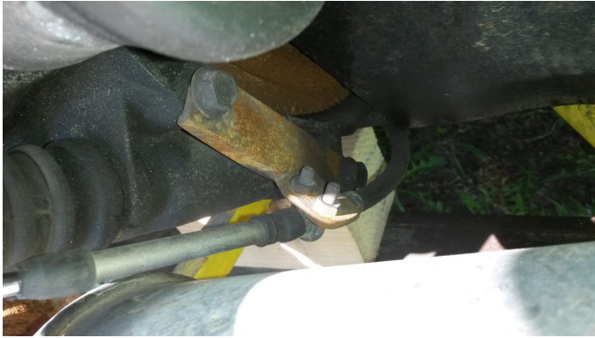
5 trinns kasse

Det er mulig at boltehull i girkassa må gjenges.