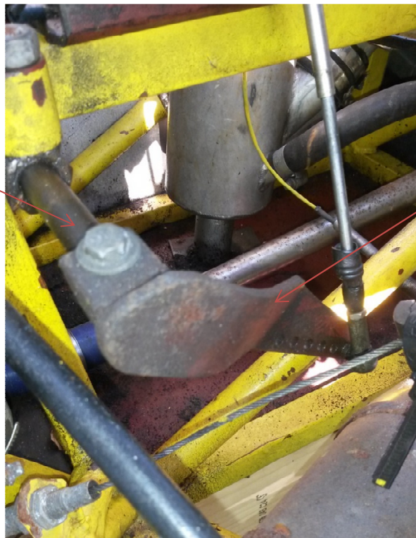
Arm med lengde 140mm fra senter stang til kulekobling