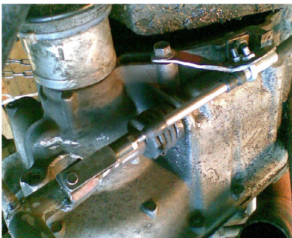
4 trinns kasse

Kabela ligger langs ramma bak til motorrommet, her går den under motoren og opp parallelt med girvelger på kassa: